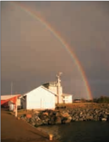
Isokarin luotsiasema aamuauringossa

Aamu alkoi aamiaisella kello kahdeksan jälkeen ja suunnitelmissa oli sukellukset majakan juuressa Daphne nimisellä hyllyllä. Laivan jäämistö lepää n. 16 m syvyydessä hiekkapohjalla, näkyvyys alueella on yleensä heikko (alle 5 m). Alus oli puurun-koinen teräsvahvistettu (komposiitti) parkkilaiva joka haaksirikkoitui ennen Jarin aikakautta (eJa. vrt. eKr.). Aamutoimien jälkeen suoritettiin kevyt briiffaus päivän odotetuista sukelluksista ja pikaisten pusikoissa käyntien jälkeen irroitettiin köydet.