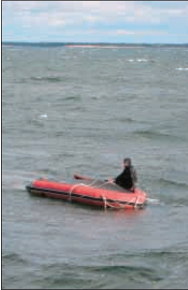
Jokohan tämä kumppari olis tyhjä?