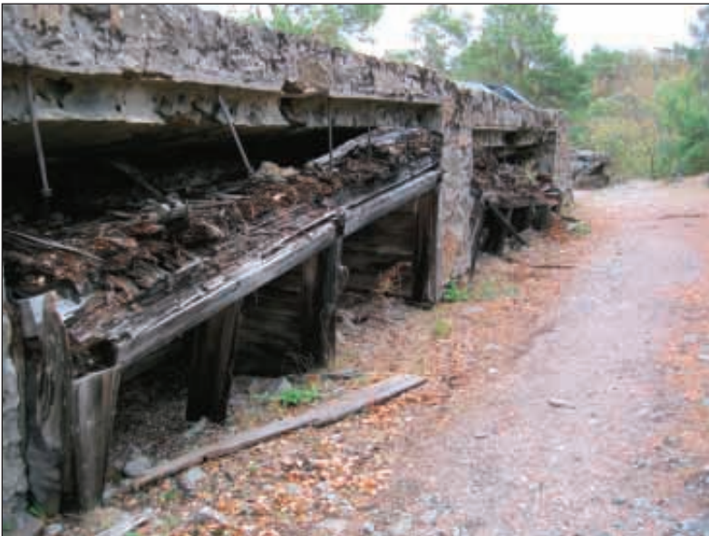
Katanpään rantapysäyksen varustuksia