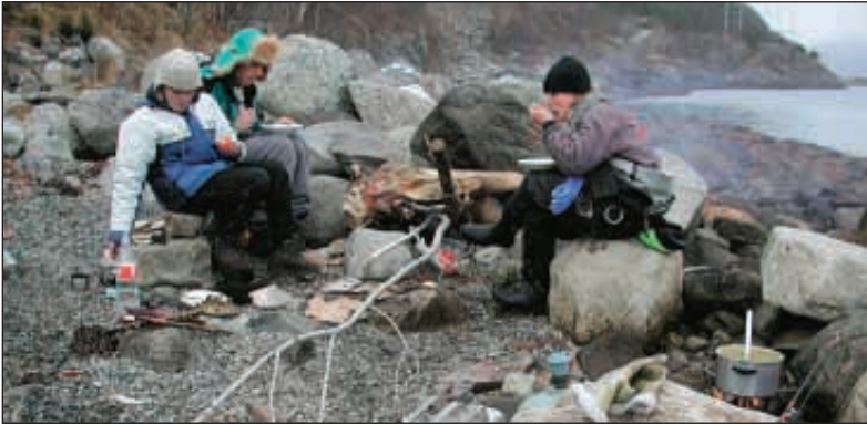
Papusoppaa lumisateessa nuotion loimusta nauttien