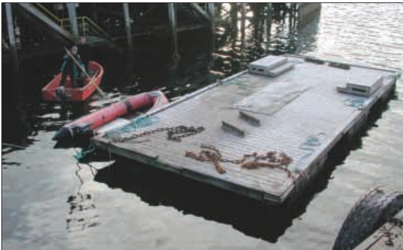
Vain portaat puuttuvat

Mökissä oli 4 sänkyä ja kulmasohva ja sen piti siis olla 6 hengen mökki.